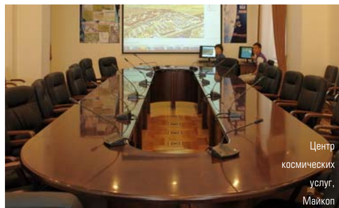
Центр космических услуг, Майкоп