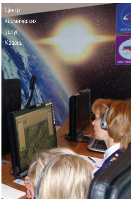
Центр космических услуг, Казань